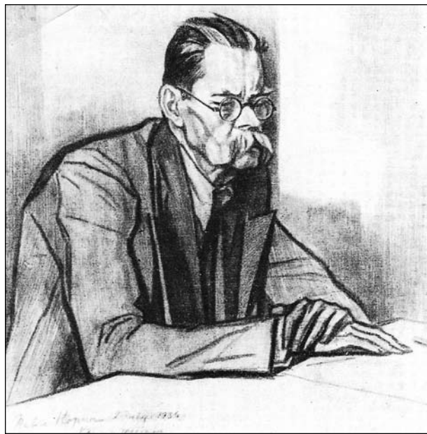
П.Д. Корин. М. Горький. Рисунок с натуры. 1936 г.

Первый шаг к созданию музейного образа писателя — Нижний Новгород. Здесь в горьковский заповедник вошли домик В. Каширина — Музей Детства, квартира в доме Н.Ф. Киришбаума и литературный музей . Будучи уже немолодым, Горький начертил план дома деда, в котором жил с матерью в 1871–1872 гг. Вместе с повестью «Детство» горьковский набросок помог создателям музея. Открывшийся 1 января 1938 г., он воспринимается сегодня как объемная иллюстрация первой части знаменитой автобиографической трилогии. Погружение в описанное и когда-то реально существовавшее пространство приземистого одноэтажного дома, окрашенного «грязнорозовой краской» [1, с. 19–20], теснота маленькой комнатки «под гробообразным потолком» и густота нелюби-