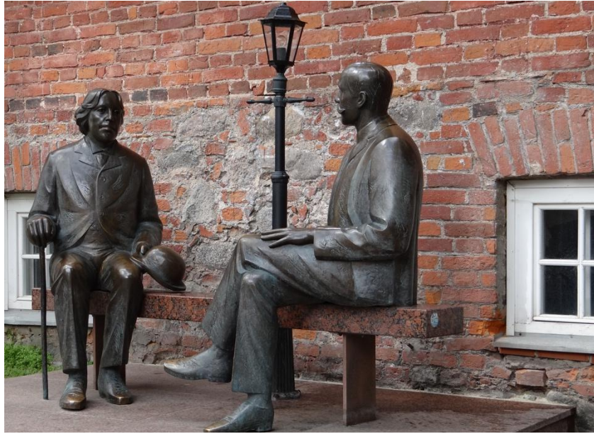
Два Уайльда в г. Тарту (O. Wilde and E. Vilde)