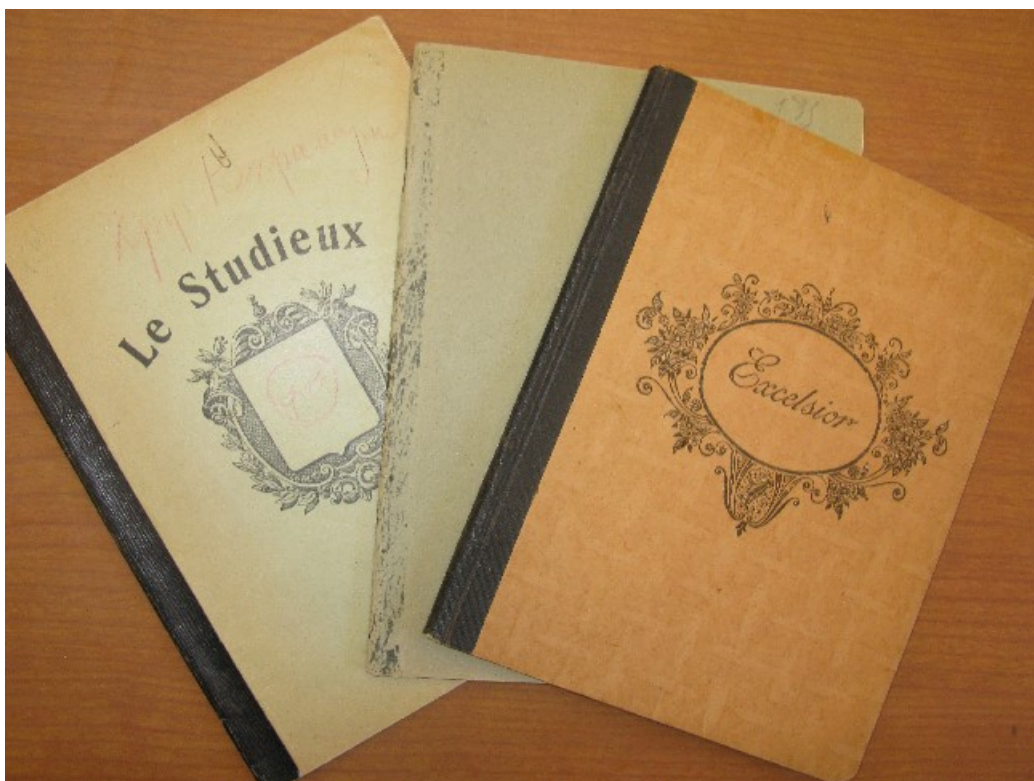
Блокноты З.Н. Гиппиус из архива Т. Пахмусс (Иллинойс, США).